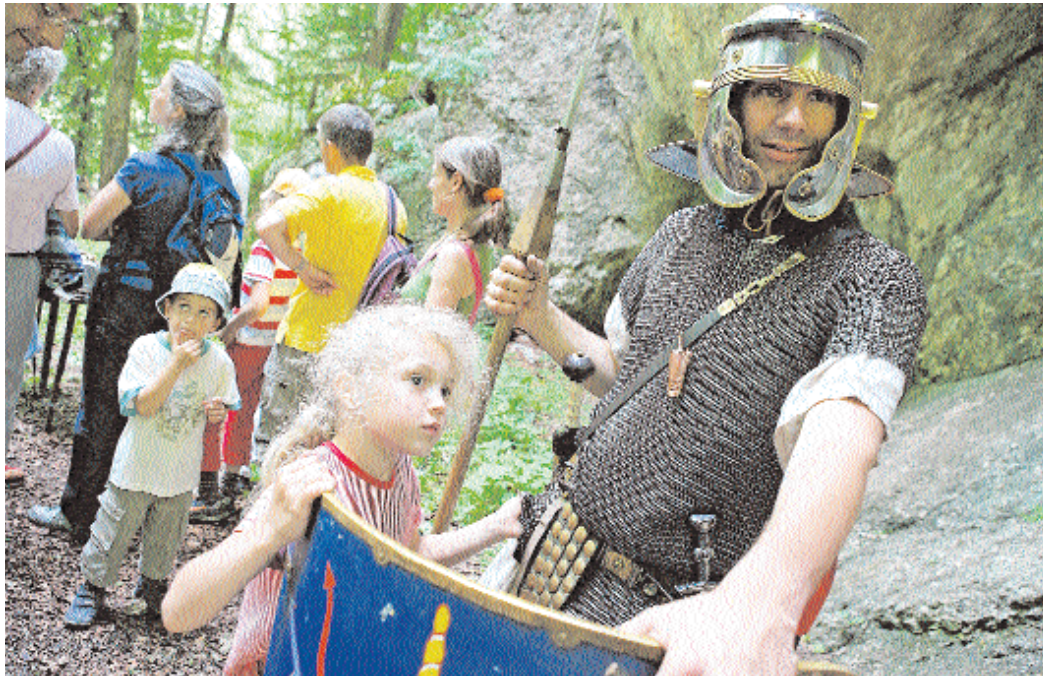
Ein Legionär zum Anfassen bei der «Petra Pertusa», dem Col de la Pierre Pertuis.

Nicht die Römer, sondern Menschen des Mittelalters waren