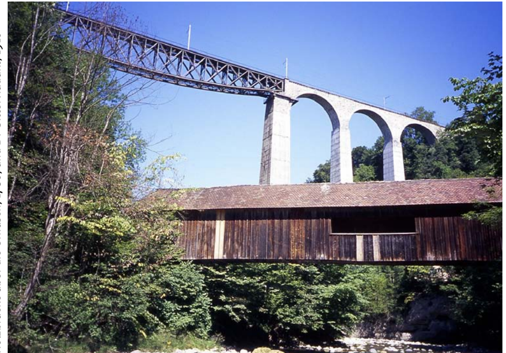
Holzbrücke über die Urnäsch, 1780, und BT-Sitterviadukt, 1910

ViaStoria Zentrum für Verkehrsgeschichte