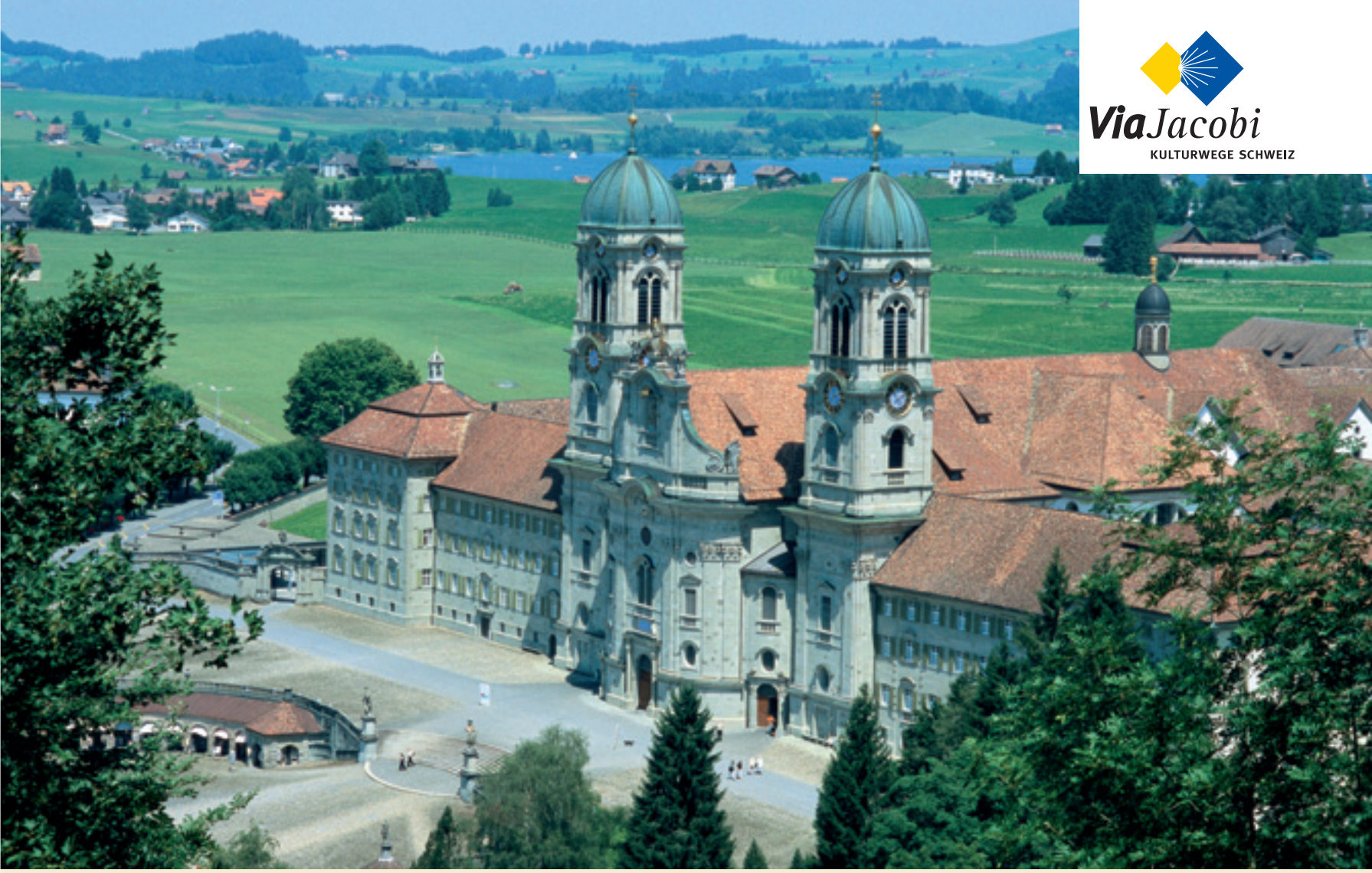
▲ Kloster Einsiedeln SZ