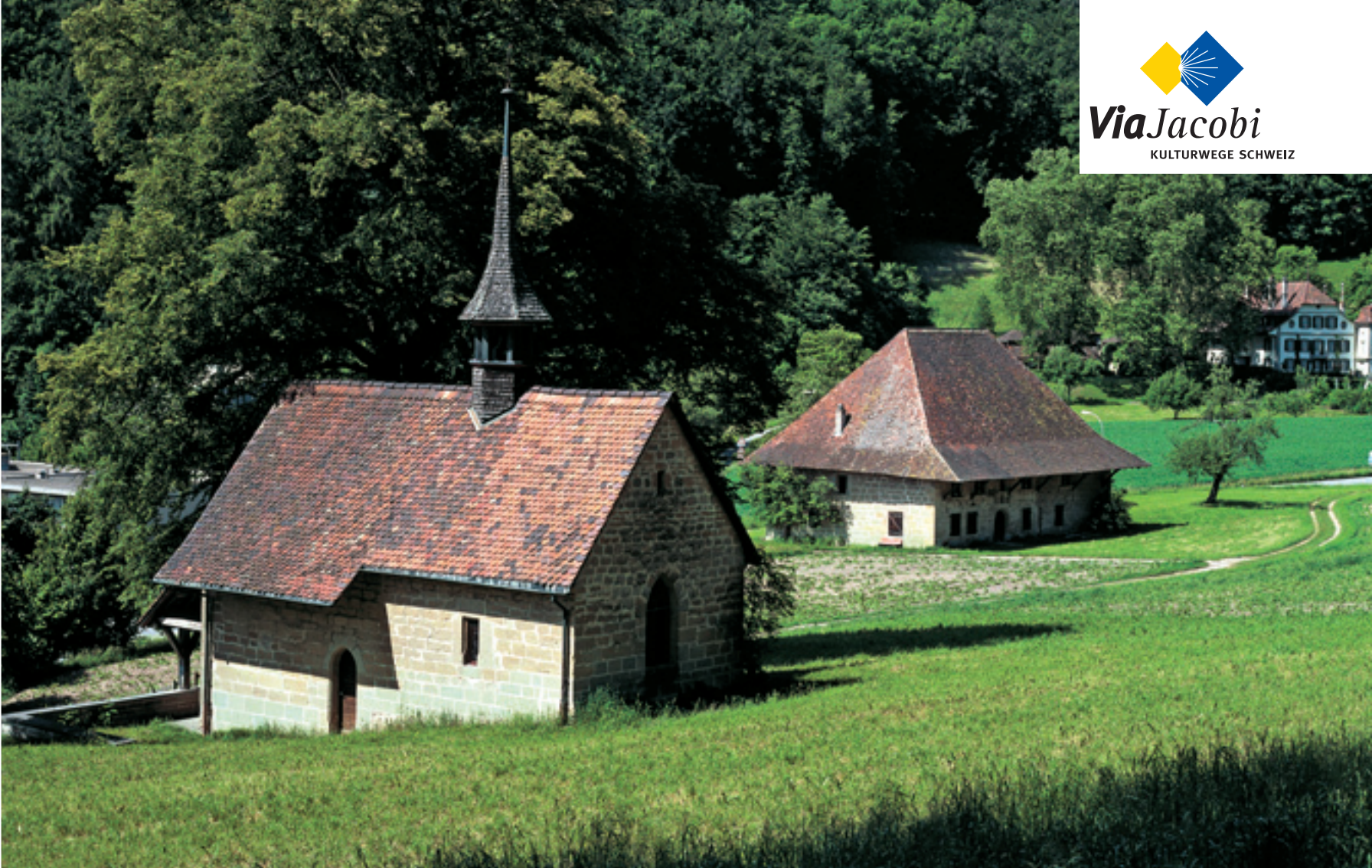
▲ Siechenkapelle und Siechenhaus Burgdorf BE