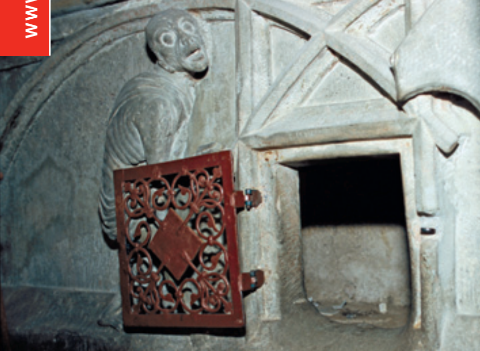
▲ «Fussloch» am Altar der heiligen Idda in Fischingen TG